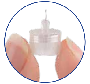
पेन की सुई वास्तविक आकार में है

^ अपने मधुमेह के इलाज के बारे में हमेशा अपने स्वास्थ्य देखभाल पेशेवर से परामर्श करें।