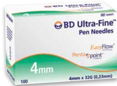
एनडीएसएस उत्पाद कोड: 101